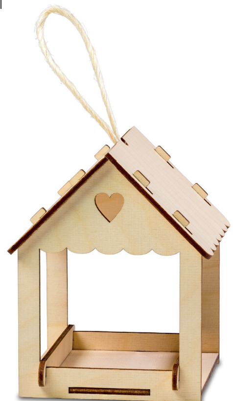
Vogelhäuschen / birdhouse

Sonderfarbe „Stand und Maße“ & „Vollfläche“ nicht zu verändern oder zu löschen. do not change or delete the special colour for "positioning and measurements" & "full surface".